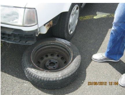
Überfahren verlorener Gegenstände